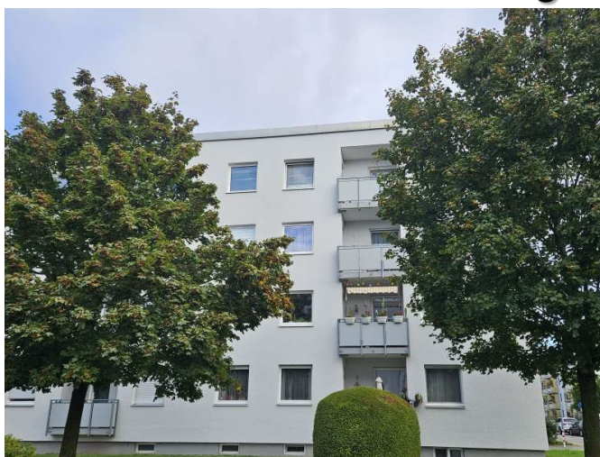
Fürstenfeldbruck – Buchenau